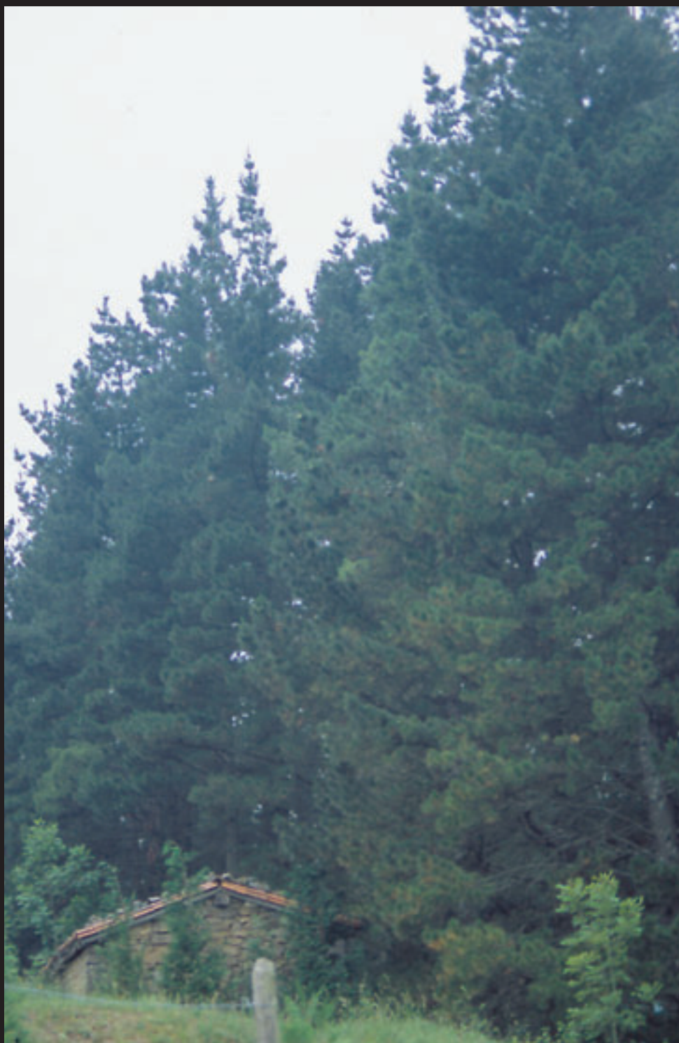
Pinu Radiata / Pinus radiata .