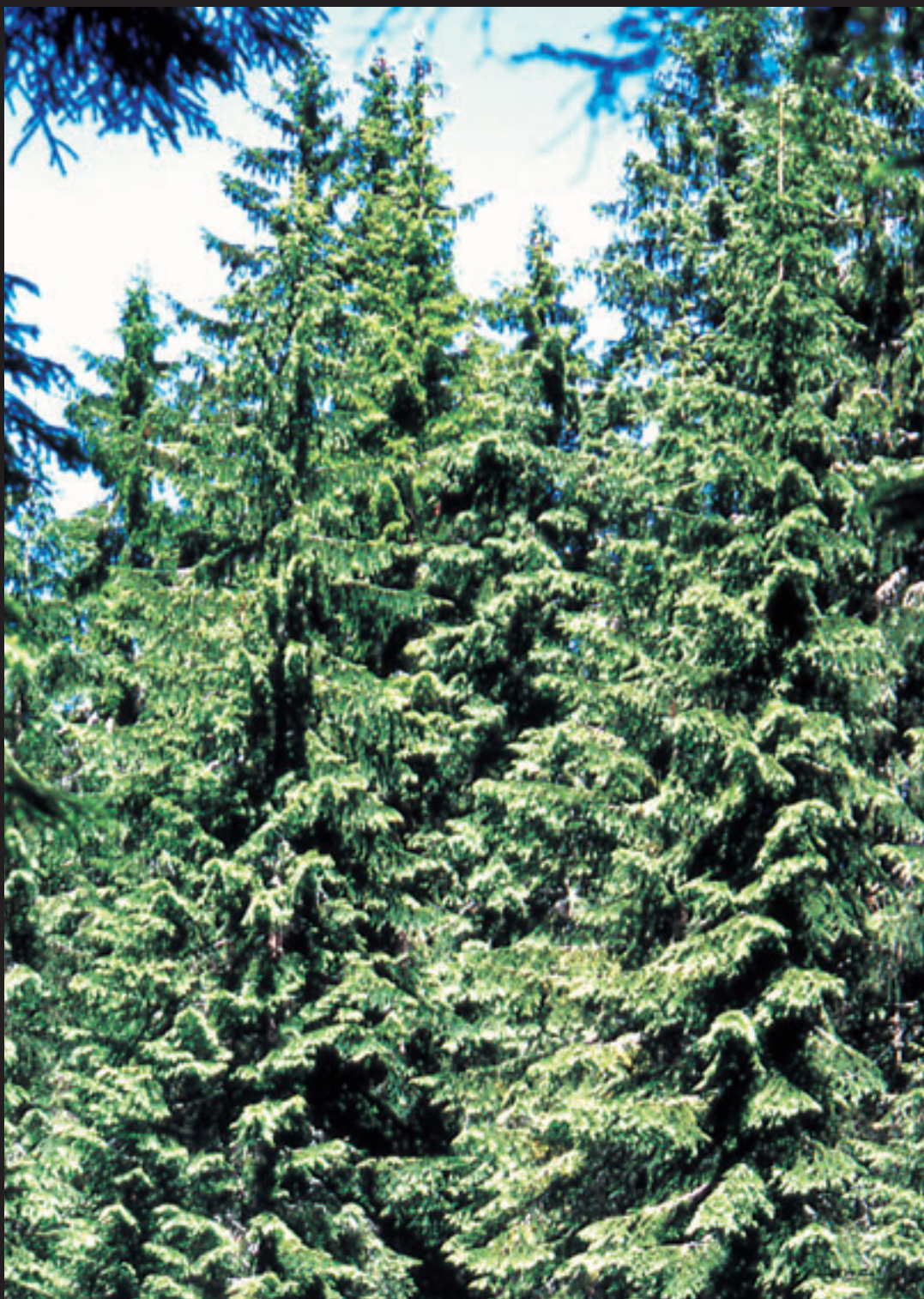
Douglas izeia. / Abeto Douglas.