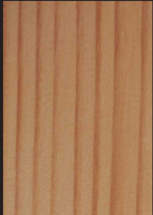
1. Hosto eta pinaburuak. - 2. Egurra.