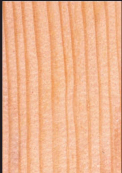
1. Hosto eta pinaburuak. - 2. Egurra.