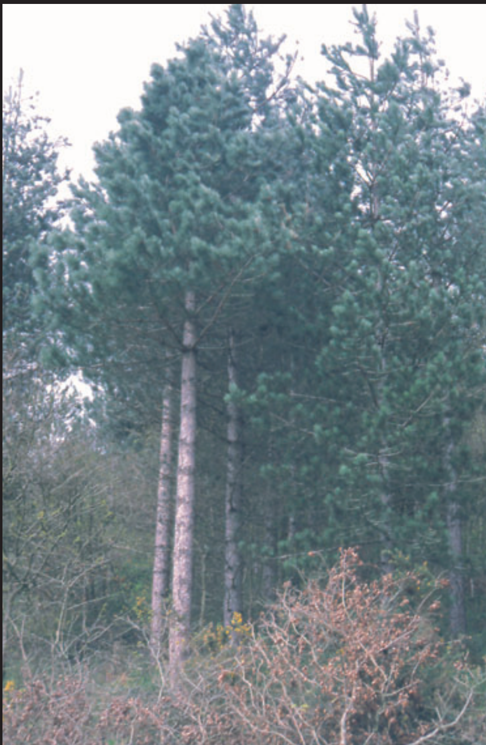
Larizio Pinua / Pinus Nigra (Pino Laricio)