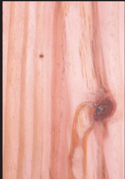
1. Pinaburuak. - 2. Egurra. 1. Piñas - 2. Madera.