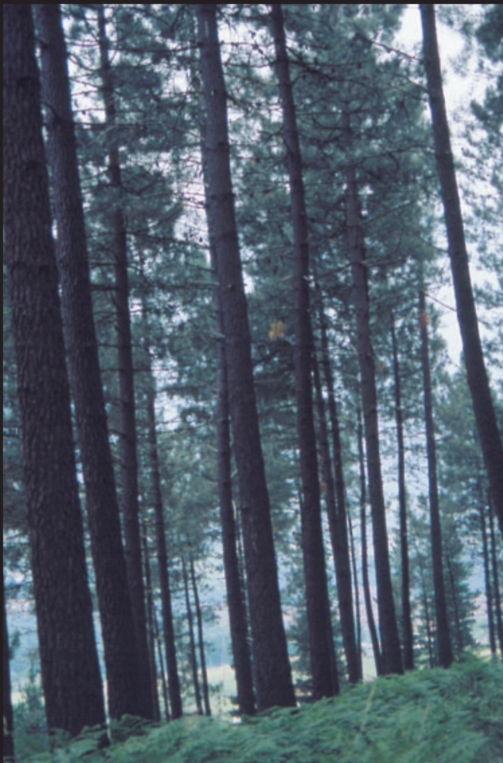
Itsas Pinua / Pino Marítimo ( Pinus pinaster )