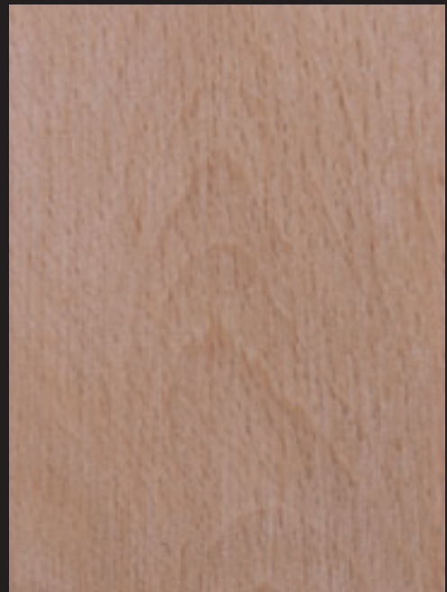
1. Hosto eta pagatxak. - 2. Egurra. 1. Hojas y hayucos. - 2. Madera.