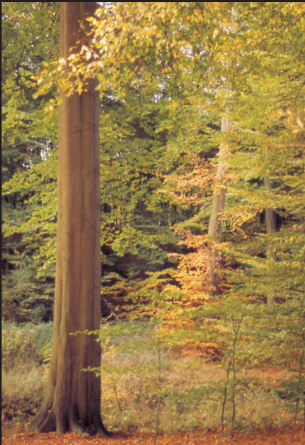
Pagoa ( Fagus Syivatica ) / Hayedo ( Fagus Syivatica )